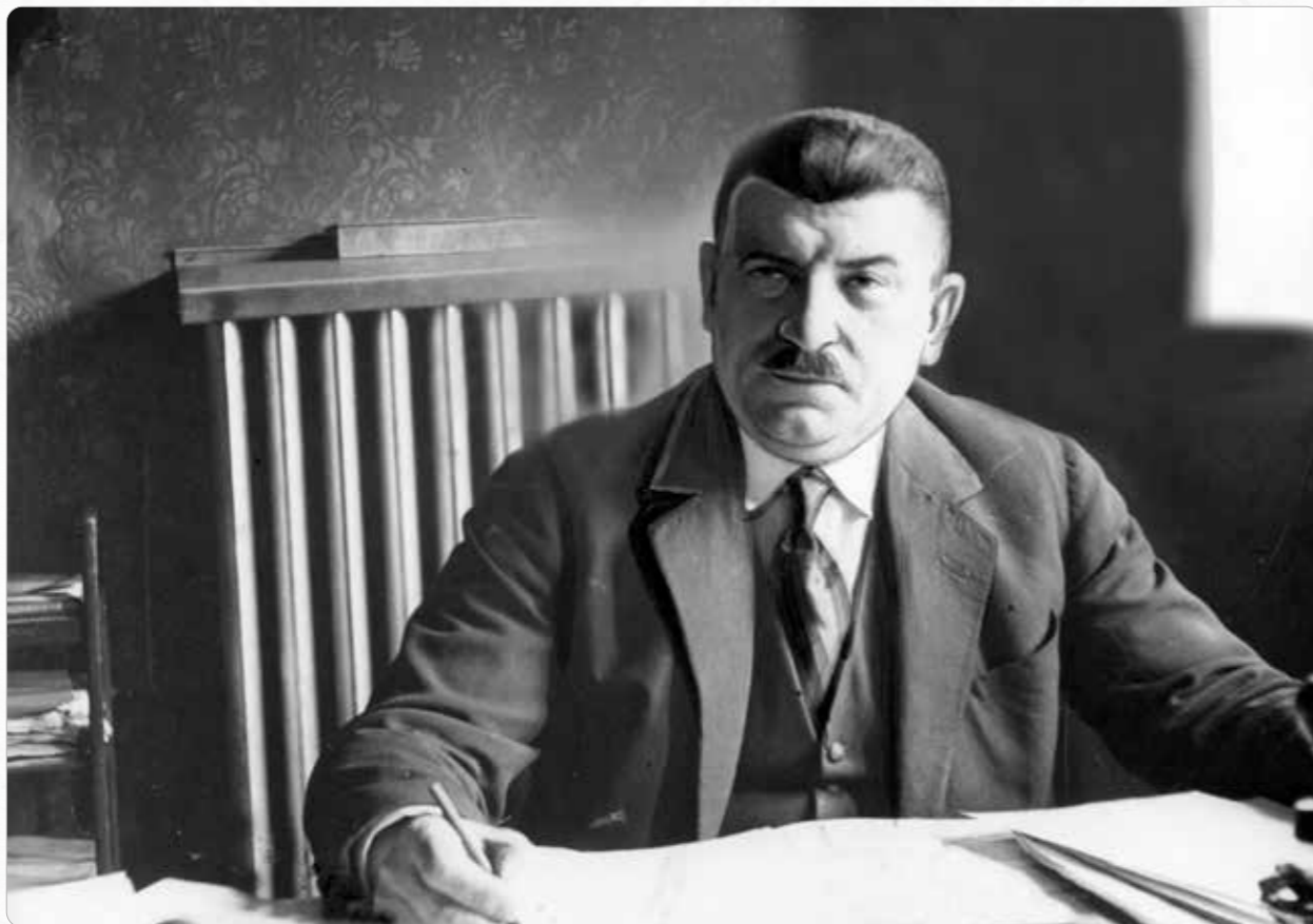
Senator Michał Grajek

Michał Grajek urodził się w 1883 roku w Popowie Tomkowym k. Gniezna. Górnik w Zagłębiu Ruhry, działacz związkowy. Uczestniczył w życiu społecznym polskiej emigracji w Nadrenii. Wszedł do władz Zjednoczenia Zawodowego Polskiego. Był karany przez Niemców za aktywność na rzecz Polaków i polskości. Na początku I wojny światowej został wcielony do armii niemieckiej. Od 1918 roku pracował w Zjednoczeniu Zawodowym Polskim w Zabrze. Był uczestnikiem trzech powstań śląskich, organizował towarzyszące im strajki. Na początku lipca 1921 roku wszedł w skład Naczelnej Władzy Cywilnej i Powstańczej, a następnie był członkiem Naczelnej Rady Ludowej na Górnym Śląsku. W 1921 roku uczestniczył w delegacji polskiego rządu na konferencję genewską w sprawie Górnego Śląska. Był tam ekspertem w sprawach robotniczych. W 1922 roku został wybrany do Sejmu Śląskiego I kadencji, gdzie powierzono mu funkcję wicemarszałka. Do 1939 roku pełnił m.in. funkcję prezesa Związku Górników Zjednoczenia Zawodowego Polskiego. Od lat 20. XX wieku organizował Narodowy Związek Powstańców i Byłych Żołnierzy. Trzykrotnie wybierano go na senatora (1928–1930, 1935–1938, 1938–1939). W czasie II wojny światowej był pod ścisłym nadzorem niemieckiej policji, krótko go więziono. Po wojnie pełnił funkcję wicedyrektora ZUS w Katowicach. Został na krótko aresztowany przez NKWD. Później pracował jako kierownik wydziału socjalnego Jaworznicko-Mikołowskiego Zjednoczenia Przemysłu Węglowego. Zmarł w 1947 roku. 13