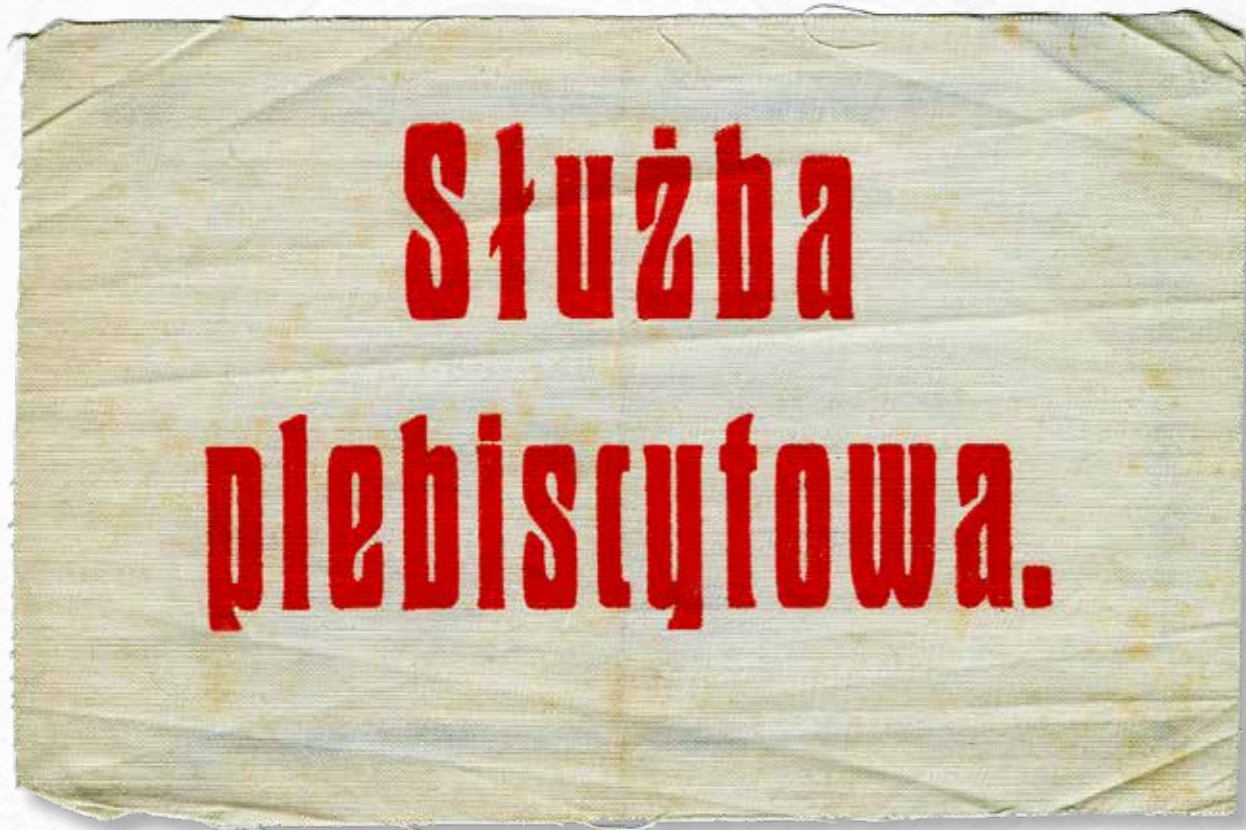
Fragment opaski senatora Ludwika Maciejewskiego z okresu, gdy działał w Polskim Komisariacie Plebiscytowym w Bytomiu, ok. 1921 r.

W latach 1922–1939, w ciągu pięciu kadencji, mandat senatora sprawowały 452 osoby, niektóre kilkakrotnie 1 . Badania biograficzne trwają. Do tej pory udało się ustalić, że do Senatu II RP trafiła niewielka grupa osób, które mieszkały na Śląsku i aktywnie uczestniczyły w wydarzeniach rozgrywających się na tych ziemiach w pierwszej ćwierci XX wieku (walka o polską świadomość wśród mieszkańców Śląska, udział w akcji plebiscytowej i w powstaniach śląskich, od 1922 roku udział w organizowaniu rodzimej administracji i scalaniu polskiego Śląska z macierzą). Ich los w dwudziestoleciu międzywojennym był ściśle związany z działalnością publiczną. Te osoby wyróżniały się w swoim środowisku, więc wysuwano ich kandydatury w wyborach do Senatu i stawali się senatorami. Można powiedzieć, że otrzymywali wyjątkowy status parlamentarzysty, a tym samym dostęp do polityków, ministrów czy nawet premierów. Do 1939 roku był to na pewno awans społeczny.