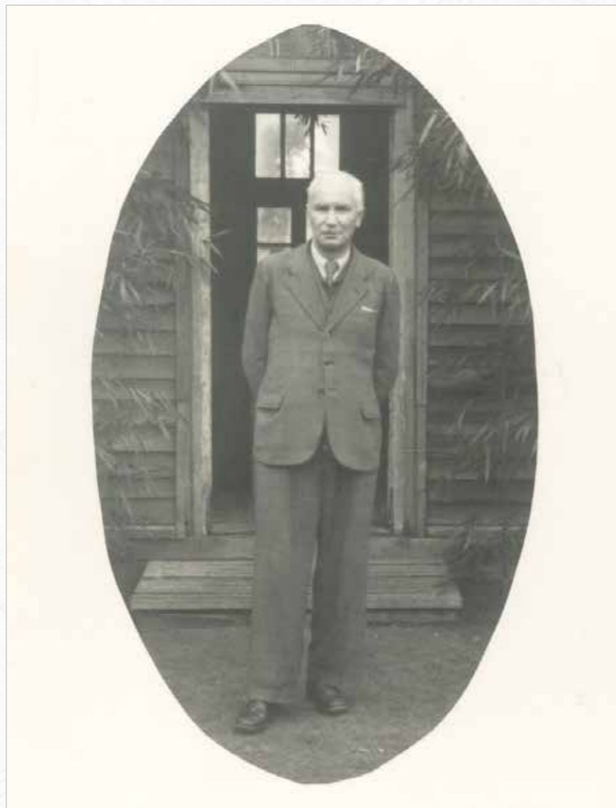
Senator Alojzy Pawelec w czasie wojennego pobytu na emigracji na pograniczu francusko-hiszpańskim, Francja, tzw. Katalonia Północna, maj 1941 r.