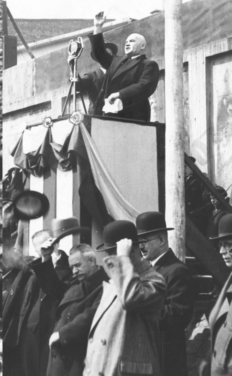
Przemówienie senatora Rudolfa Kornegó podczas ogromnej manifestacji antyniemieckiej w Królewskiej Hucie (obecnie Chorzów) na placu targowym przy ul. Bytomskiej, kwiecień 1933 r.