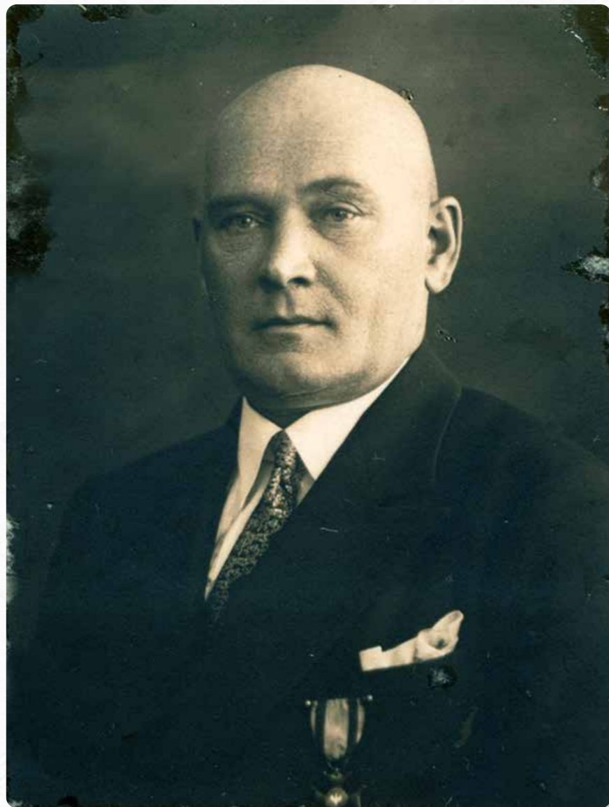
Senator Rudolf Kornke

[Wojskowe Biuro Historyczne – CAW, sygn. I.482.78-7496]