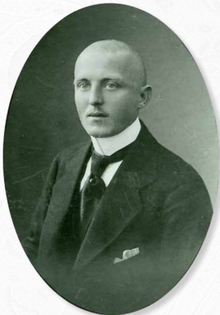
Senator Ludwik Maciejewski