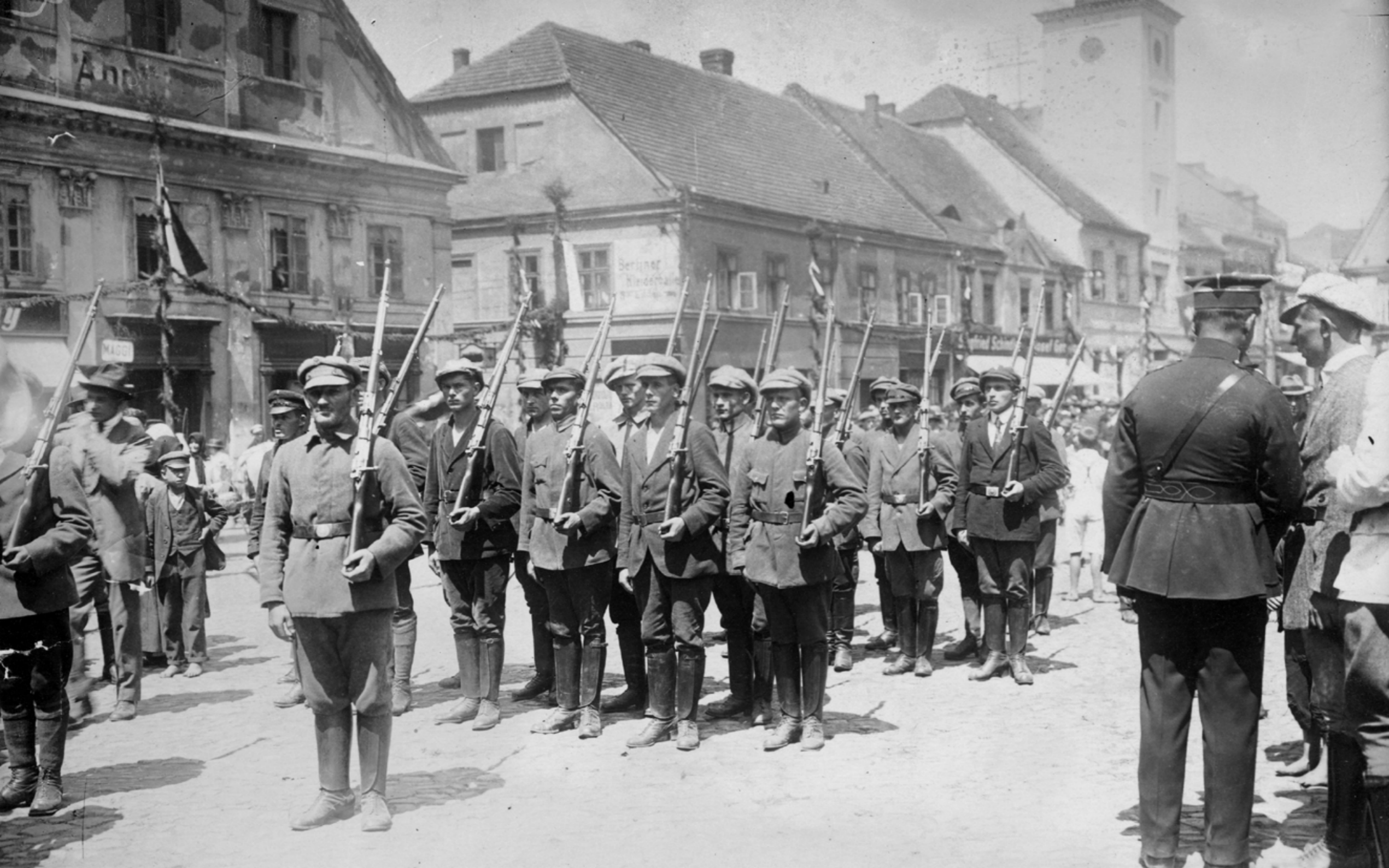
Pododdział ochotników w trakcie III powstania śląskiego, Rybnik 1921 r.