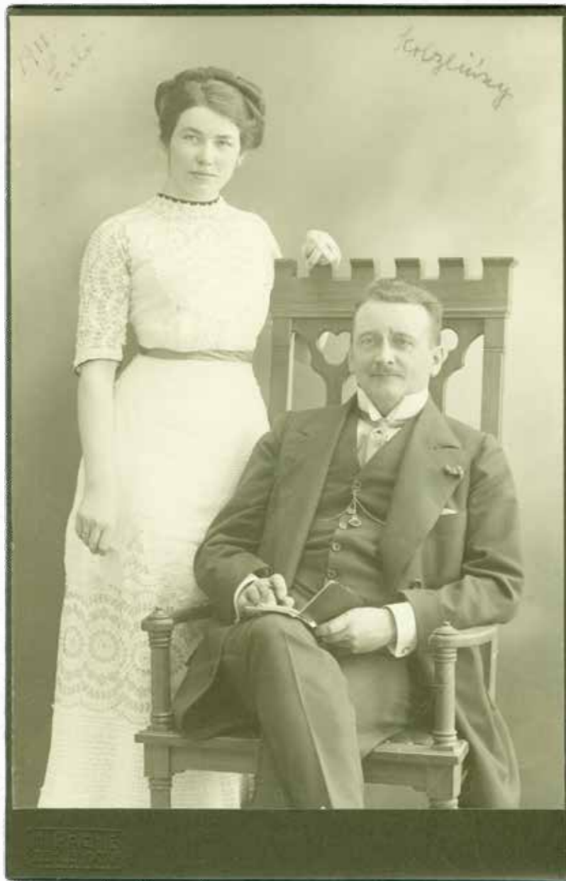
Senator Stanisław Kobyliński z żoną Małgorzatą, 1911 r.